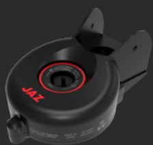
Accesorio / Accessory Mod. JS BSP